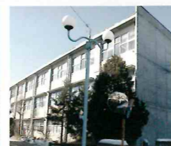
■佐久病院看護専門学校